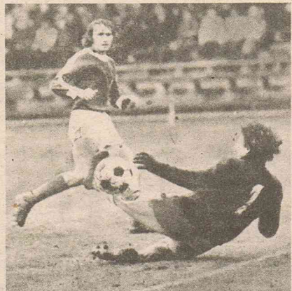
Wismut Aue hofft, auf die Torgefährlichkeit von Erler so schnell wie möglich wieder bauen zu können.